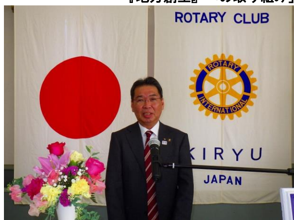
桐生RC名誉会員・桐生市長 亀山 豊文 様