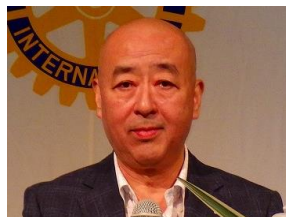
「ガバナー補佐講話」