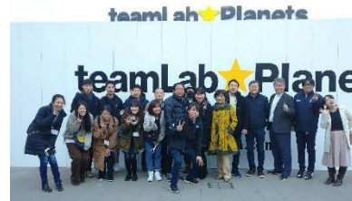
チームラボプラネッツ TOKYO(見学)

桐生 RAC 創立 50 周年記念事業として、東京ツアーを開催いたしました。桐生 RAC とその他の RAC 関係者の皆様と桐生 RC からは、9 名参加して頂きました。