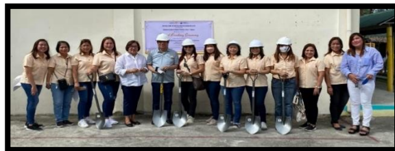
(プリラン・ロイヤル RC の皆さま)