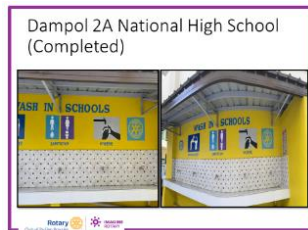
(手洗い場 水飲み場)