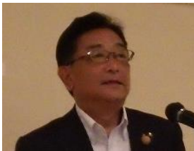
3.来賓挨拶 桐生市長 荒木 恵司 様